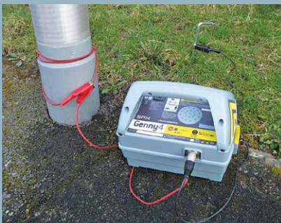
Techniken zur Ortung von Kabeln mit kleinen Querschnitten